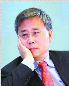
原中国证监会主席郭树清

市场经济必然走向法治经济，法治已经成为引领、促进和保障市场经济发展的重要力量。中国资本市场的改革和发展始终坚持市场化、法治化的发展道路，在短短二十多年的时间内取得了令世人瞩目的成就。目前，我们已经建立起一个市值排名世界第三的股票市场。观察资本市场发展的历程，我们可以清晰地看到法治建设在市场改革和发展中的重要作用。