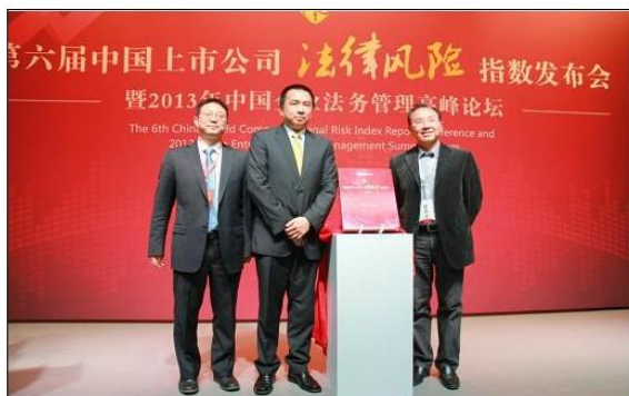
第六届中国上市公司法律风险指数发布

2013年12月09日 09:16 来源: 金融界股票 网友评论 (0人参与) 白银大赛千万实盘资金派送中